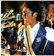
చూపించనున్నారు. ఏప్రిల్ 24న ప్రపంచవ్యాప్తంగా ఈ చిత్రం రిలీజ్ కు రూపొందింది. ఈ చిత్రం పరిశీలనలకు 10 ఏళ్ల కోట్లు రాబట్టవచ్చని ఇండస్ట్రీలో టాక్ ఉంది.

పాపే సింగర్ గా ప్రపంచ ఖ్యాతి గాంచిన మైకెల్ జాక్సన్ జీవిత కథ ఆధారంగా ఓ సినిమా రూపొందింది. మూవీకి సంబంధించిన ట్రైలర్ ఇటీవలే విడుదలైంది. జాక్సన్ లెగిసి ఆయన కుటుంబం నుంచి ఎవరూ కొనసాగించలేదు. అయితే, మైకెల్ జాక్సన్ ఐదు పిల్లలను ప్రపంచానికి చూపించాలని ఆయన మేనల్లుడు జాఫర్ ముందుకొచ్చారు. తాజాగా ఈ మూవీ నుంచి ట్రైలర్ ను విడుదల చేశారు. ఈ చిత్రాన్ని దర్శకుడు ఆంటోయిన్ ఫుకా దర్శకత్వం వహించారు. ఈ మూవీలో మైకెల్ జాక్సన్ గా ఆయన మేనల్లుడు జాఫర్ కనిపించనున్నారు. జాక్సన్ మృతి చెందిన 16 ఏళ్ల తర్వాత ఈ మూవీ వస్తోంది. మైకెల్ జాక్సన్ నుంచి సూపర్ హిట్స్ రాగా విడిగిన ప్రయాణాన్ని ఈ మూవీలో